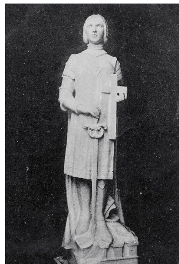
Statue de marbre dans l'église Sainte Jeanne d'Arc