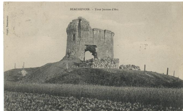
Carte de Cassini XVIII ème siècle, donc époque de notre couple . La Tour Jeanne d'Arc, elle devait déjà être ainsi au XVIII ème .