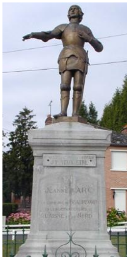
Statue de Jeanne d'Arc dans la commune