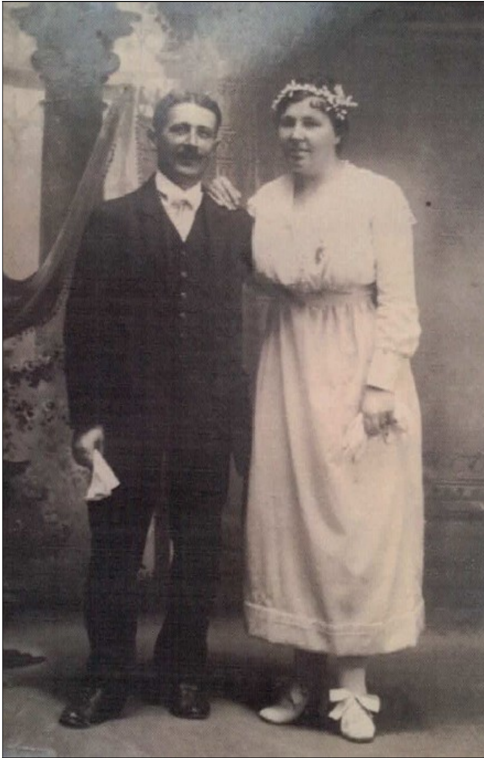
Fay-aux-Loges (Loiret), le 09 août 1919